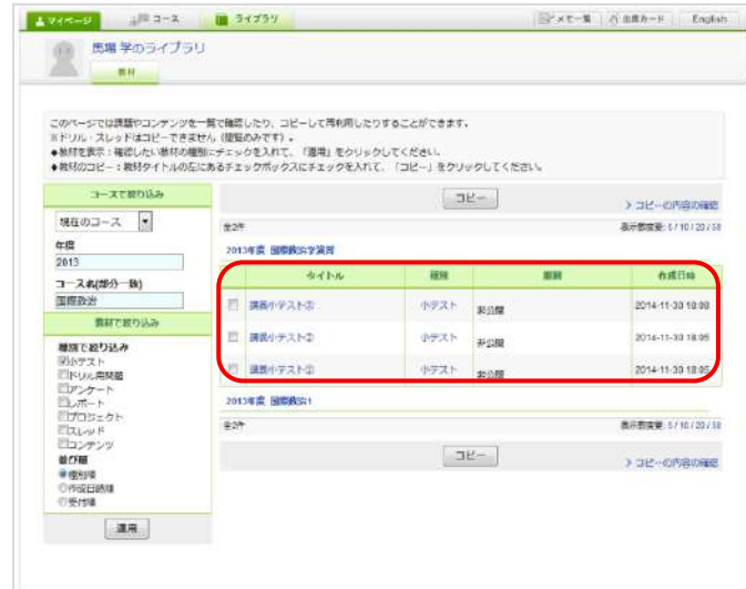
ライブラリ(教材絞り込み後)