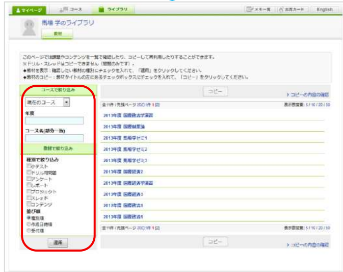
ライブラリ(教材絞り込み前)