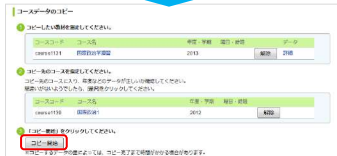
コピー(コース選択済み)