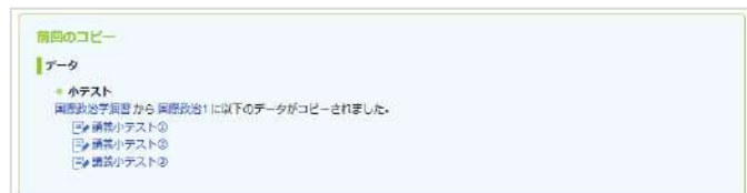
前回のコピー内容