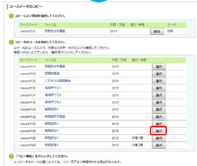
コピー(コース未選択)