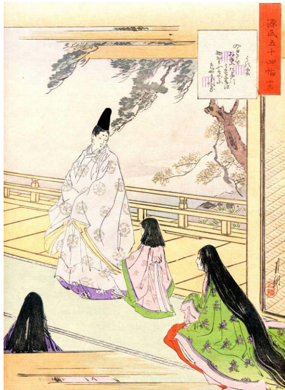
尾形月耕画 源氏物語薄雲