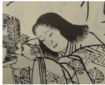
(頭部を改刻した馴木)

ちらさじとおほふばかりの袖はありやは」を散らし書きし、上方に人物や状況の説明を付す。早期刊行された掲出本と、後出改刻の異版とを比較していただきたい。