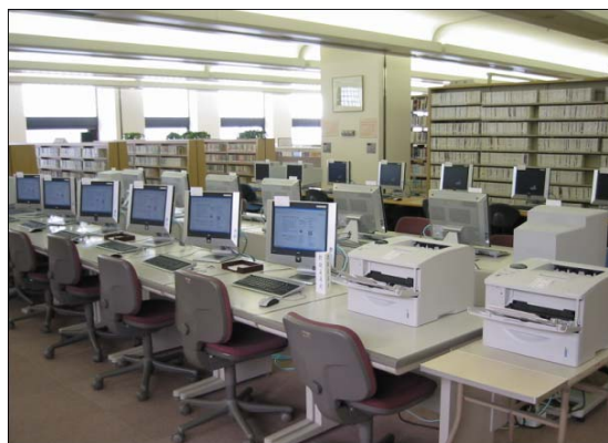
(キャンパス・フロンティア・スポット : CFS)

借りている本の確認ができたり、購入希望や複写依頼などを、インターネットを通して研究室や自宅からできるようなサービスの準備も進めています。